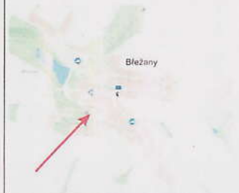
DOPRAVNÍ ZNAČENÍ - Břežany, DZ č. B20a (2x), B1, IP10a, E13

ČESKÁ REPUBLIKA MĚSTSKÝ ÚŘAD BŘEŽANY Městský úřad Břežany Městský úřad Břežany Městský úřad Břežany