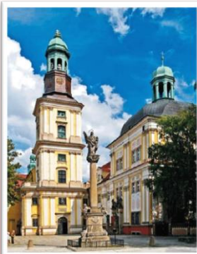
Bazilika sv. Bartoloměje a sv. Hedviky Slezské