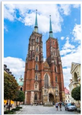
Katedrála sv. Jana Křtitele

Kláster sester sv. Hedviky - místo založení Kongregace