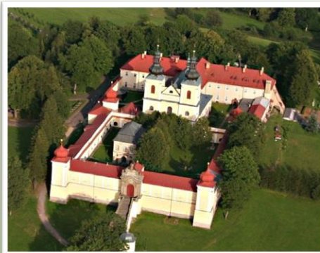
Hora Matky Boží